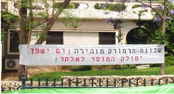
תופעת ה-NIMBY Not In My Back Yard

אלן מילשטיין הציג את ההתפתחויות בתחום שילוב ילדים עם מוגבלויות בבתי ספר רגילים.